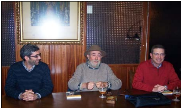
Guy durante la presentación de sus libros

No soy muy exigente sobre el resultado de la pesca y puedo disfrutar de un día "bolo" pero siempre digo que hay bolos buenos y bolos malos, bolos buenos cuando no haces nada porque no hay nada que hacer y bolos malos cuando podías hacer algo y no hiciste nada.