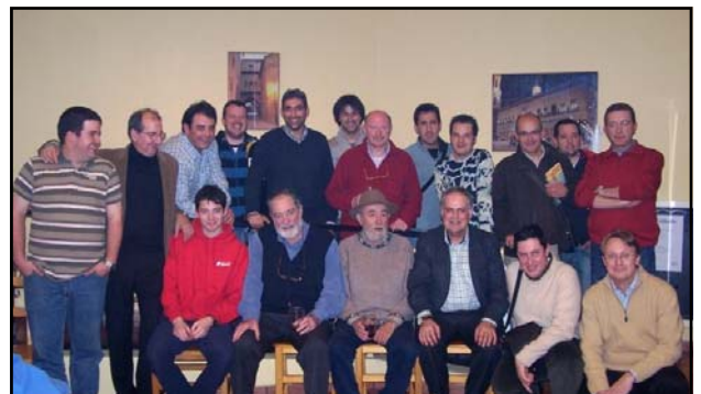
Entre amigos antes del lunch

"Los que no creen en el éxito no lograrán nunca nada"