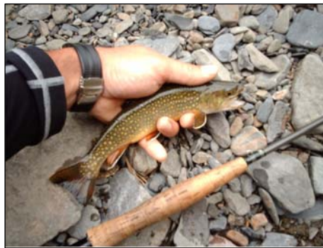
Preciosa librea la de estos peces, y temibles fauces para cualquier invertebrado.

Consejo: No os sintáis tentados por el río antes de llegar a la zona donde se encuentran los salvelinos, perderéis un tiempo precioso, que con la magnitud del lugar nos puede venir bien. Hay alguna truchilla, pero pocas.